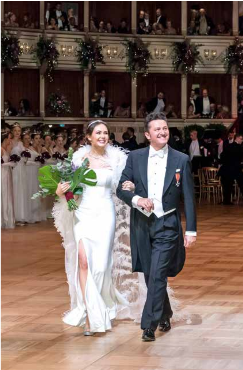
Aida Garifullina und KS Piotr Beczala bei der Opernball-Eröffnung 2020